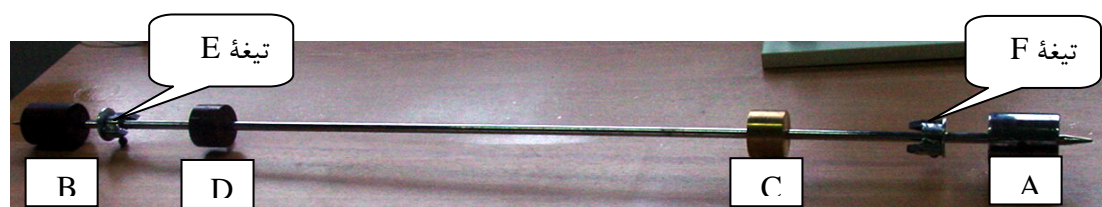
شکل ۲- شمای کلی آونگ کاتر مورد آزمایش

که هنگام نوسان حول هر یک از دو انتها (لبه تیغه‌های E و F ) اثر مقاومت هوا بر آن یکسان باشد. لبه تیغه‌های E و F در هنگام نوسان روی یک پایه قرار می‌گیرند. باید دقت نمود که اولاً تیغه‌ها به صورت کاملاً افقی روی پایه قرار گیرد و تمام قسمت‌های آن به سطح پایه تکیه داشته باشد، ثانیاً برای حفظ تقارن ظاهری دستگاه مهره‌های C و D را باید همیشه به فواصل متساوی از دو انتهای میله قرار دارد. این آونگ با آنکه کاملاً متقارن به نظر می‌رسد لکن بعلت یکسان نبودن وزن مخصوص وزنه‌ها مرکز ثقل آن در وسط قرار ندارد و به وزنه A نزدیکتر است.