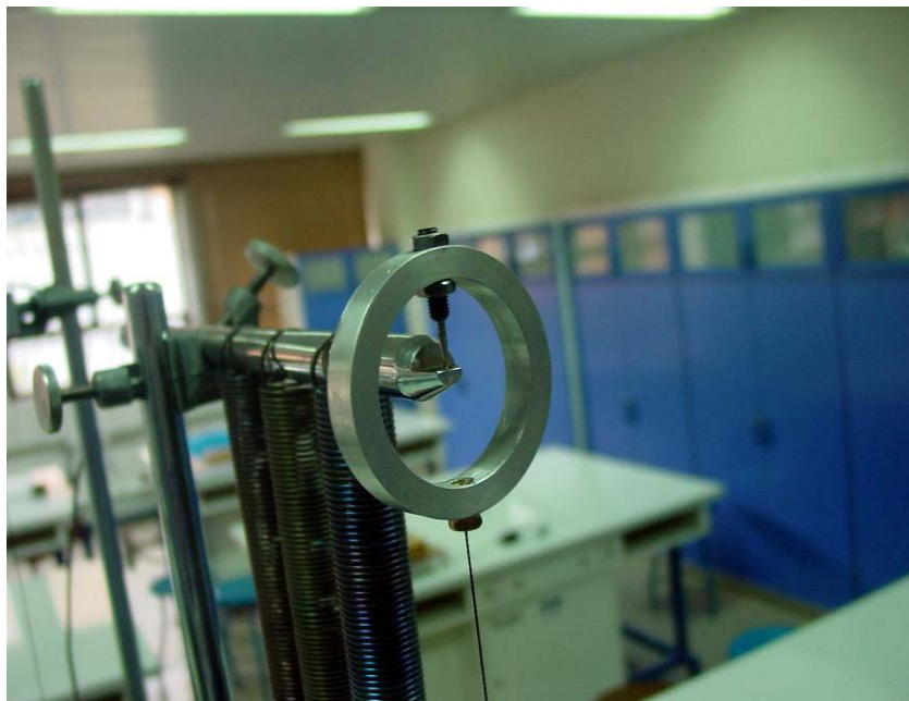
شکل ۲- نحوه قرار گرفتن سوزن حلقه روی تکیه گاه

حلقه آلومینیومی متصل کرده و سوزن حلقه را مطابق شکل ۲ روی تکیه گاه قرار دهید. انتهای دیگر نخ را به گلوله آونگ وصل کنید. طول نخ را طوری تنظیم کنید که فاصله محل آویز (تکیه گاه سوزن حلقه) تا مرکز جرم گلوله آونگ ۶۰ سانتیمتر باشد. زمان ۵۰ نوسان با دامنه کوچک (زاویه انحراف کوچکتر از 6^\circ را اندازه گرفته و در جدول ۳ یادداشت کنید. آزمایش را ۵ بار تکرار کنید و جدول ۳ را کامل کنید. لازم به ذکر است که نبایستی نخ به دور حلقه آلومینیومی پیچیده و یا گره شود که باعث بروز خطا خواهد شد. سپس آزمایش را برای زاویه 30^\circ درجه تکرار کنید و جدول ۴ را پر کنید.