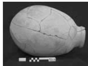
سفال مرمت شده با کد ۵۰۶-۷۲۹-۸۱- چ ز

با یک قلم موی نرم لایه‌ای از محلول پارالوئید در استون با درصد سه بر تمام سطح سفال می‌کشیم. این مرحله به ویژه برای سفال‌های با ساختار ضعیف الزامی است، تا موجب استحکام بیشتر آن شود.