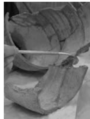
وصالی ظرف سفالین

برای وصالی سفال در کارگاه مرمت سفال پروژه حفاظت و مرمت چغازنبیل و هفت‌تپه از محلول پارالوئید در استون با درصد بین سی تا پنجاه استفاده می‌شود.