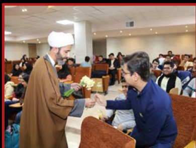
گرامیداشت روز دانشجو با حضور مسئول نهاد رهبری شنبه ۶ آذر