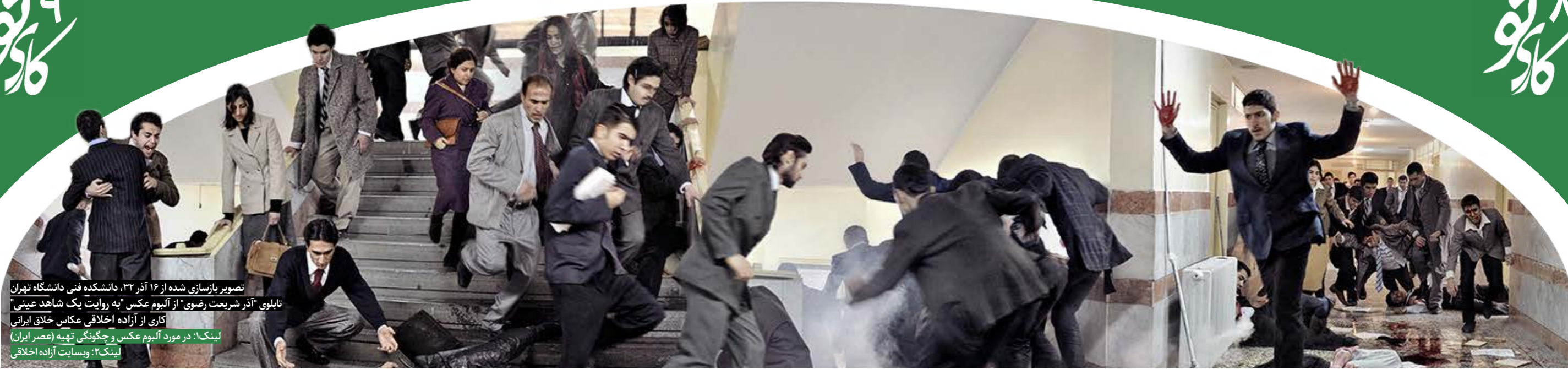
تصویر بازسازی شده از ۱۶ آذر ۳۲، دانشکده فنی دانشگاه تهران تابلوی "آذر شریعت رضوی" از آلبوم عکس "به روایت یک شاهد عینی" کاری از آزاده اخلاقی عکاس خلاق ایرانی لینک ۱: در مورد آلبوم عکس و چگونگی تهیه (عصر ایران) لینک ۲: وبسایت آزاده اخلاقی