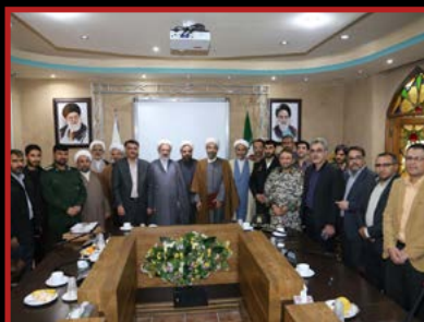
مراسم تودیع و معارفه مسئول جدید دفتر نهاد رهبری چهارشنبه ۱۳ آذر