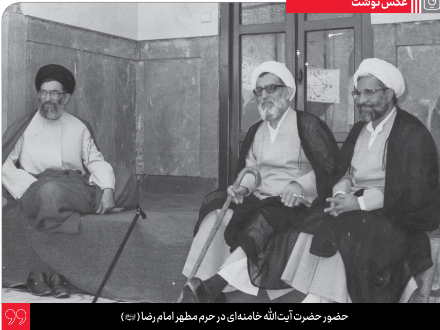
حضور حضرت آیت الله خامنه ای در حرم مطهر امام رضا (ع)