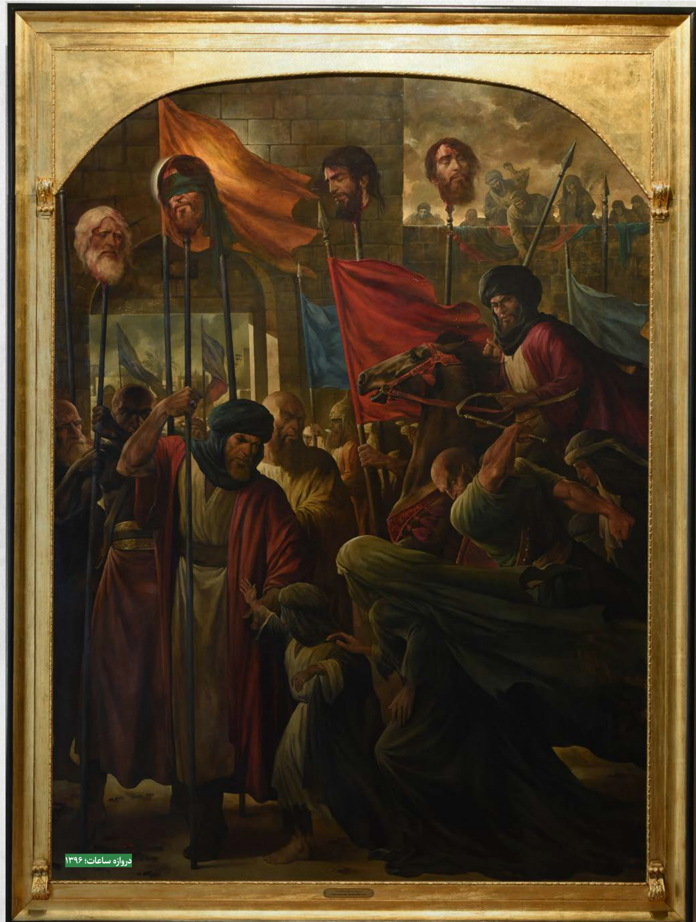
دروازه ساعات؛ ۱۳۹۶

باب الساعات از ورودی های مسجد اموی دمشق بوده که در بالای آن، ساعت بزرگی قرار داشت. به آن باب جیرون نیز می گفتند. نام گذاری آن به باب الساعات را به جهت وجود ساعتی در بالای آن دانسته اند. سهل ساعدی چگونگی ورود اسیران به شهر دمشق از دروازه ساعات را گزارش کرده است. به گفته وی، سرهای بریده، بر نیزه و همراه اسیران در حرکت بودند و سکینه دختر امام حسین از وی خواست چیزی به نیزه د/ان بدهد تا سرهای شهدا را کمی جلوتر از اسیران حرکت دهند تا نامحرمان به زنان و دختران کاروان نگاه نکنند. منبع: ویکی شیعه