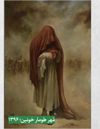
مهر طومار خونین؛ ۱۳۹۶