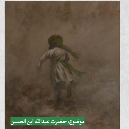
موضوع: حضرت عبدالله ابن الحسن