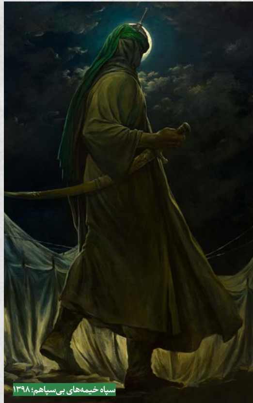
سیاه خیمه های بی سپاهم؛ ۱۳۹۸