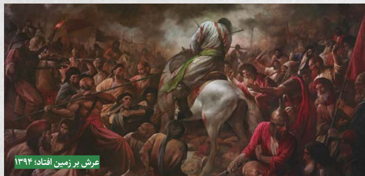
عرش بر زمین افتاد؛ ۱۳۹۴