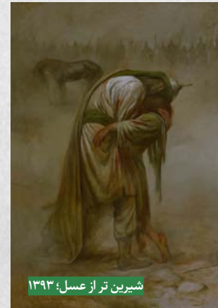
شیرین تر از عسل؛ ۱۳۹۳