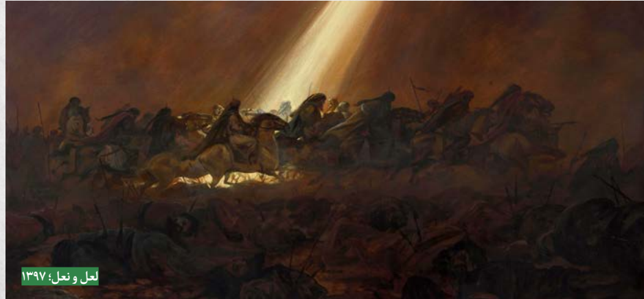
لعل و نعل؛ ۱۳۹۷