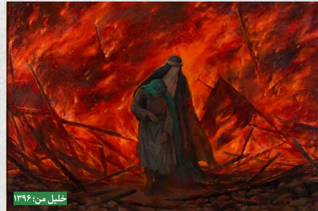
خلیل من؛ ۱۳۹۶