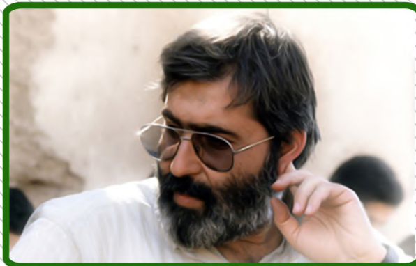
شهید سید مرتضی آوینی

هر چه داریم از اوست این اوست که دست ما را به نخل بلند وجود رسول الله (ص) خواهد رساند قله بلند را ماند که سیلاب از قله اش بر ما فرو میریزد اگر چه پرنده عقل و معرفت ما هرگز به چکاد بلند وجود او نخواهد رسید