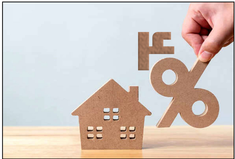
مقدار خانه های لوکس کشور

با توجه به گزارش خبرگزاری تسنیم تاکنون ۱۴هزار خانه لوکس در کشور شناسایی شده است و فرآیند وصول مالیات از آنها آغاز شده است و انتظار می‌رود که حدود ۱ میلیون خانه لوکس در سرتاسر کشور وجود داشته باشد ضمناً خانه لوکس در این قانون به خانه ای گفته می‌شود که قیمتی بالای ۲۰میلیارد تومان داشته باشد.