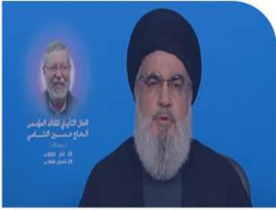
سخنرانی سید حسن نصر الله دبیر کل حزب الله لبنان به مناسبت بزرگداشت فرمانده مجاهد «حسین الشامی» در منطقه ضاحیه جنوبی بیروت

■ امروز اسرائیل در بحران به سر می برد و در تاریخ این رژیم غاصب تاکنون اینقدر سستی، بحران، آشفتگی، کشمکش داخلی، یاس و بی اعتمادی نبوده است. آیا وزیری در کابینه ای که به دنبال برقراری روابط با کشورهای عربی است می گوید که ملت فلسطین وجود نداشته است یا حواره باید محو شود؟ هنگامی که تا این اندازه حماقت در میان سران صهیونیست وجود دارد می فهمیم که پایان این رژیم نزدیک شده است و علت تهدید ما هم به زوالش مربوط می شود