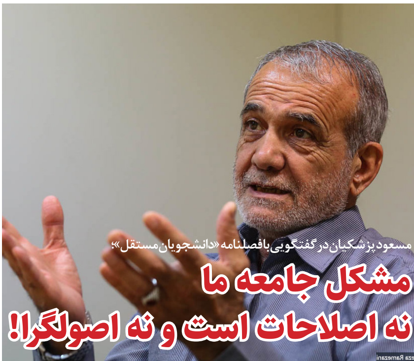
مسعود پوزشکیان در گفتگویی با فصلنامه «دانشجویان مستقل»