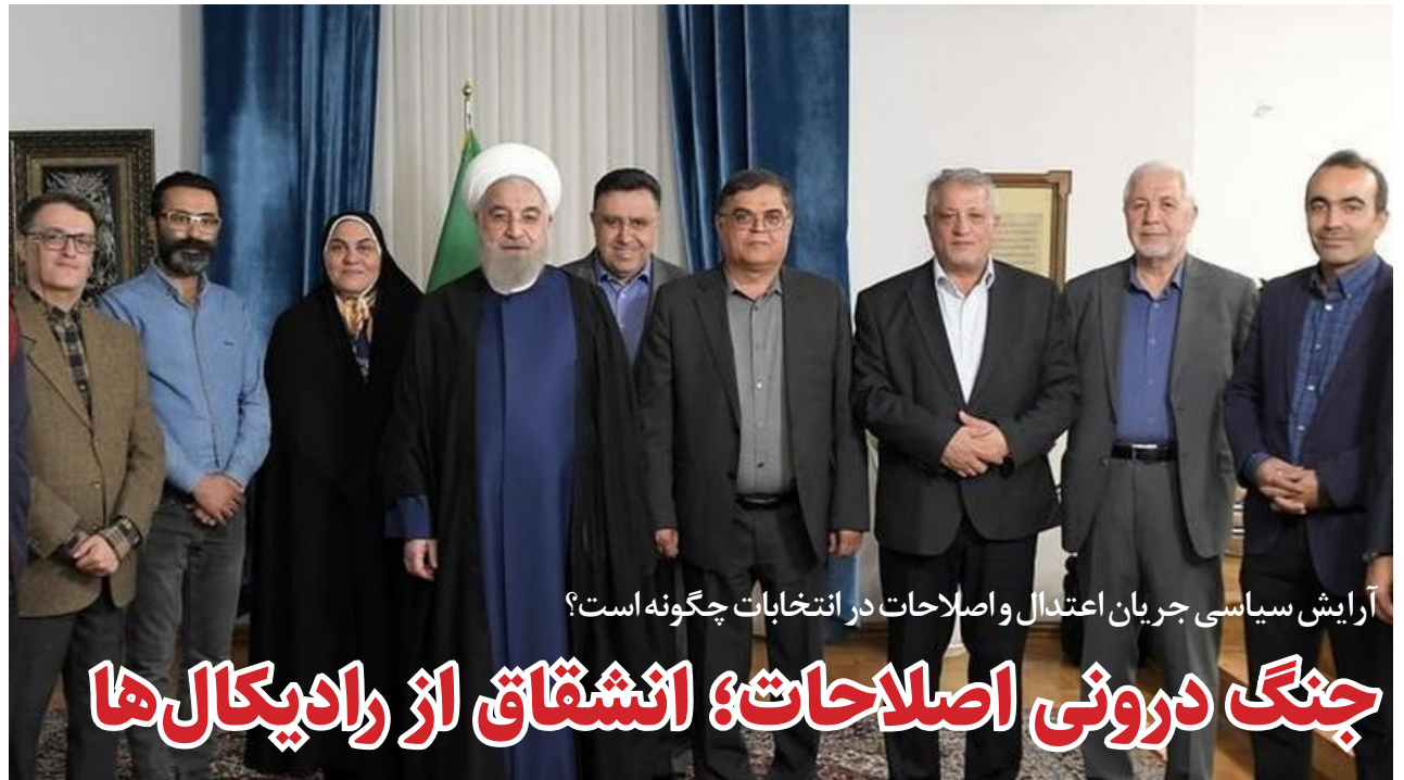
آرایش سیاسی جریان اعتدال و اصلاحات در انتخابات چگونه است؟