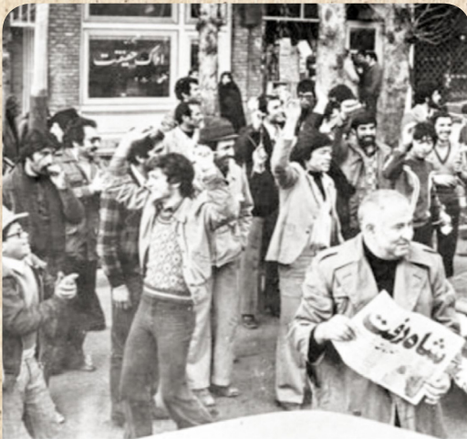
موج شادی پس از فرار محمدرضا پهلوی